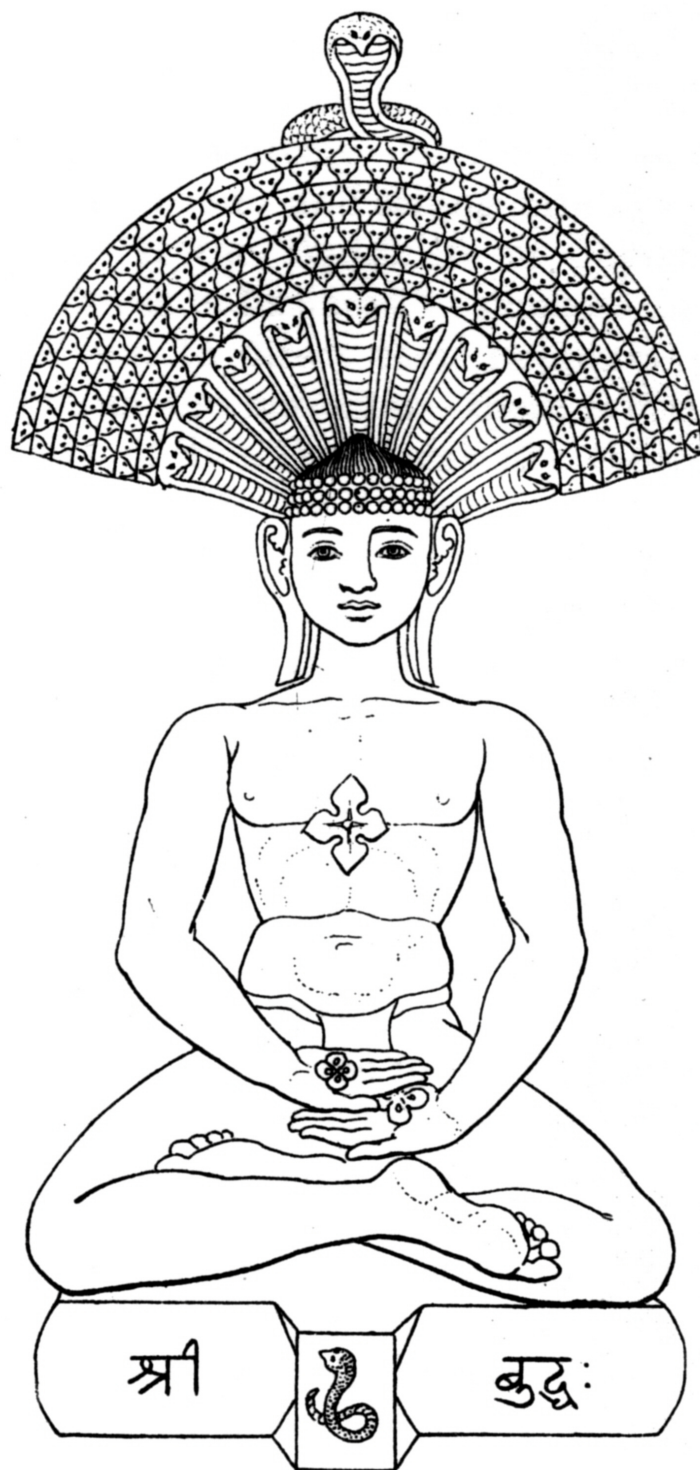
SESH DISGUISED AS BUDDHA.

Quelle: Arthur Lillie: >India in primitive Christianity<, London 1909.