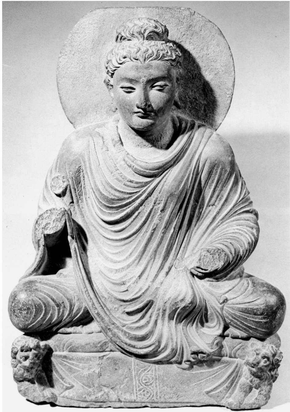
Sitzender Buddha (Gandhara 2./3. Jh. u. Zr.)